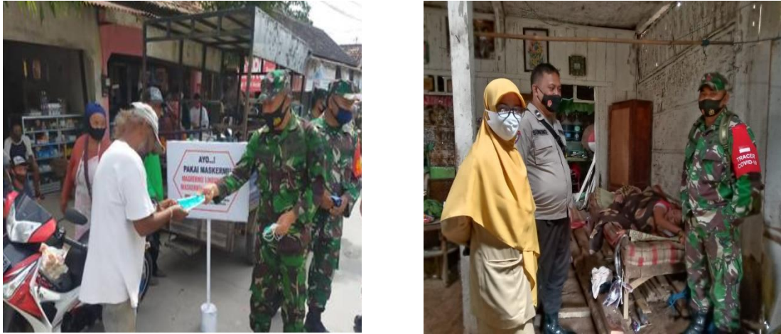
Gambar 4. Sosialisasi Covid-19 oleh Babinsa

Kodim 0816 dalam proses sinergitas dengan Kabupaten Sidoarjo yaitu dengan memberikan pembinaan kepada masyarakat. Pembinaan yang dilakukan melalui langkah Persuasi pembatasan kerumunan, Perkuat soliditas warga, Pengendalian aktivitas social. Babinsa memberikan sosialisasi dan meyakinkan masyarakat bahwa vaksinasi covid 19 aman diberikan kepada seluruh masyarakat dan mengeliminir hoax yang berkembang.