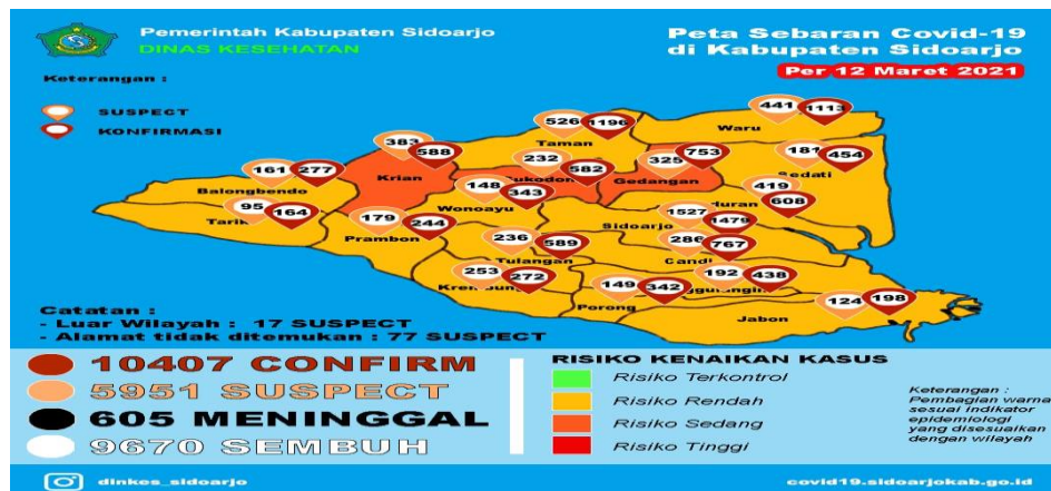
Gambar 2. Peta Sebaran Covid-19 di Kabupaten Sidoarjo

Berdasarkan data di atas, Kecamatan yang penambahan jumlah terkonfirmasi positif Covid-19nya terbanyak yaitu Kecamatan Taman sebanyak 7 orang.